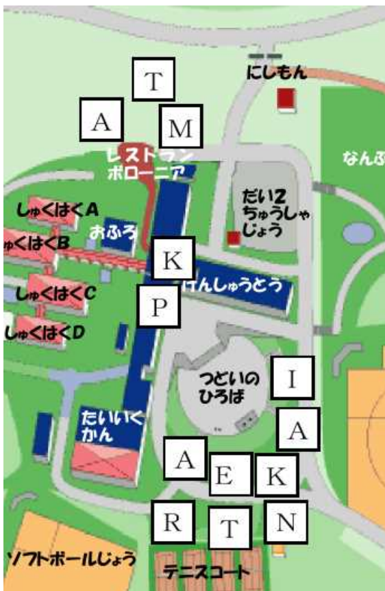
ヒントカードのズームアップ写真の例