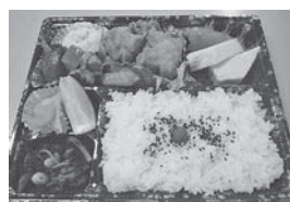
幕の内弁当 (※季節により内容に変更有り)