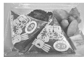
おにぎりA弁当 (おにぎり2個)