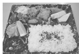
幕の内弁当 (※季節により内容に変更有り)