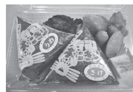
おにぎりA弁当 (おにぎり2個)