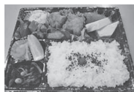
幕の内弁当 (※季節により内容に変更有り)