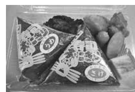
おにぎりA弁当 （おにぎり2個）