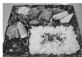
幕の内弁当 （※季節により内容に変更有り）