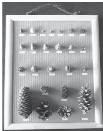
【大】木の実 24 個