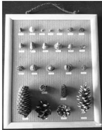
【大】木の实 24 個