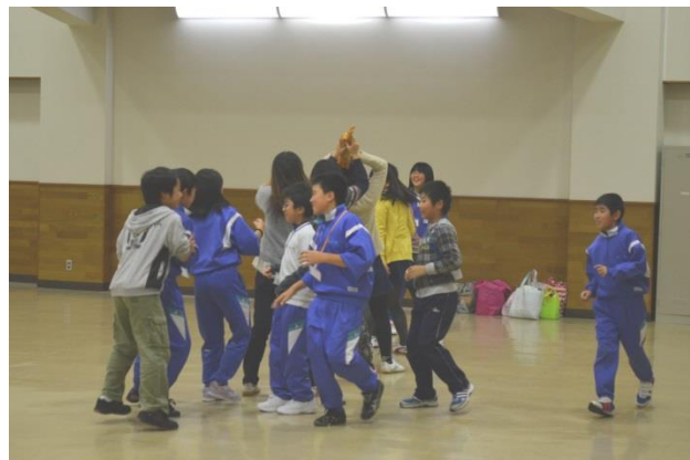
交流レクリエーションゲーム