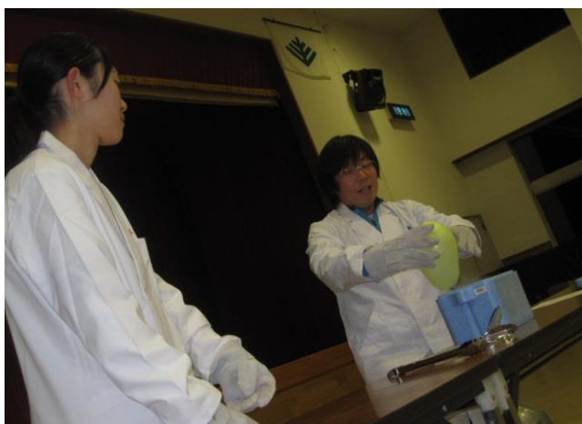
職員による科学実験ショー