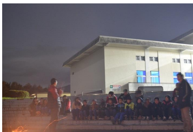
星空観察 (はじめに星座の話を行う)